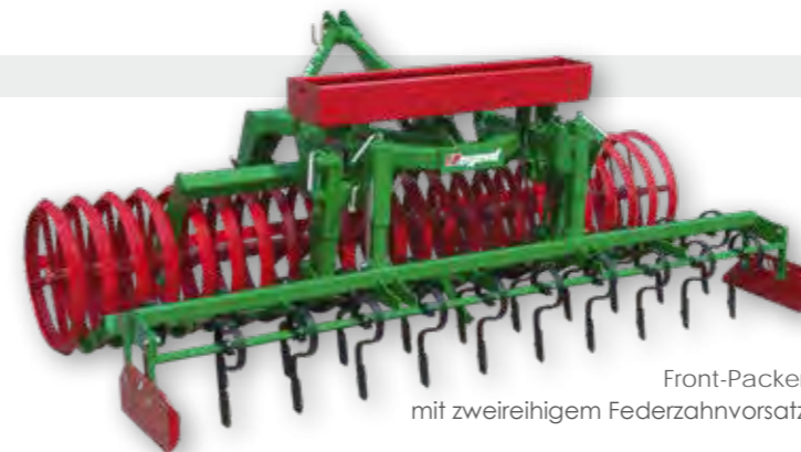
Front-Packer mit zweireihigem Federzahnvorsatz