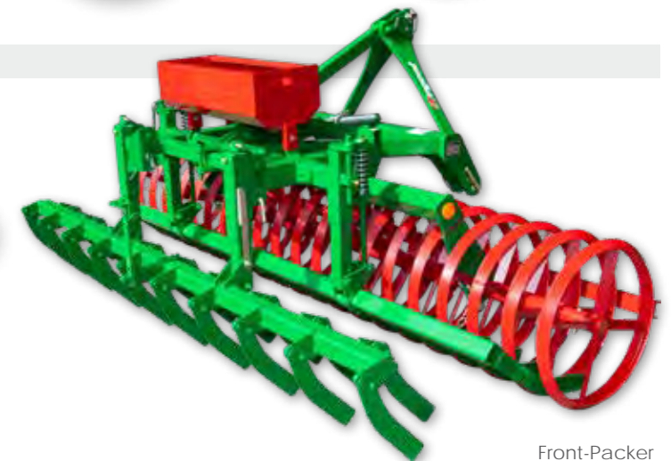
Front-Packer mit Messervorsatz